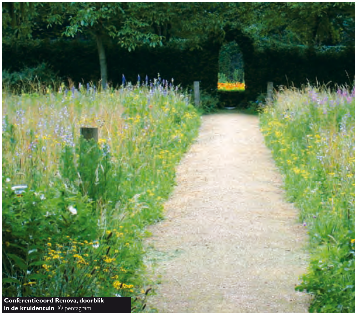
Conferentieoord Renova, doorblik in de kruidentuin