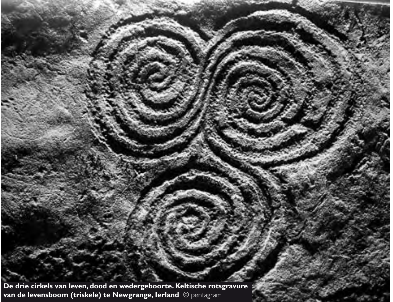
De drie cirkels van leven, dood en wedergeboorte. Keltische rotsgravure van de levensboom (triskele) te Newgrange, Ierland

symbolische wijze de bewustzijnskrachten aangeduid die rond het ruggenmerg en het verlengde merg circuleren, waarvan het bewustzijn de uitdrukking en de vlam is. Het wordt in de esoterische leringen ook wel genoemd: 'het slangenvuursysteem'. Als de geestkern werkelijk is ontstoken, is de nieuwe ziel daarin als een fluïde aanwezig.