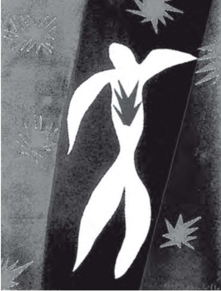
Stof zijn we – sterrenstof