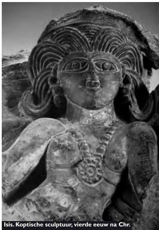
Isis. Koptische sculptuur, vierde eeuw na Chr.

Als er iets is waaraan de wereld in de periode die nu aanbreekt behoefte heeft, zijn het wel mannen en vrouwen die getuigen van een werkelijk spiritueel leven, dat wil zeggen, een leven waarin de geest actief is. Soms is daarvan op subtiële wijze al iets te zien, in de manier waarop mensen problemen oplossen of waarop dingen worden gezegd of gedaan.