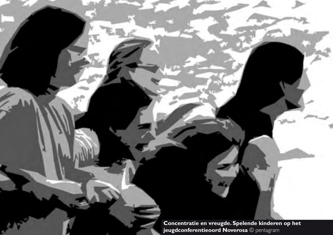
Concentratie en vreugde. Spelende kinderen op het jeugdconferentieoord Noverosa

DE TWEEDE LEVENSHELFT Als de mens een lange levensloop is gegund, dan zijn de volgende fasen van zeven jaren een herhaling van de eerste zeven periodes, maar nu omgekeerd. De eerste zeven levensfasen laten een duidelijk naar buiten gerichte ontwikkeling en groei zien. De laatste ontwikkeling voltrekt zich echter naar binnen. Bij de oude Egyptenaren dacht men, dat het hart, dat naast levensmotor bij hen ook het centrum van het denken vormde (!) tot aan het vijftigste levensjaar groeide in kracht en omvang, en daarna weer inkromp.