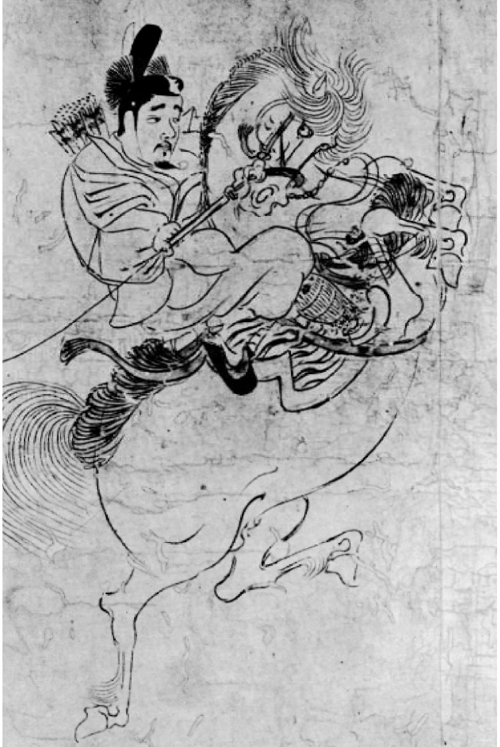
Een gardist rijdt hoge school. Nobuzane, ca. 1200 n. C.

wees erop en elke nieuwe poging in de toekomst zal er steeds op wijzen: de ikmens behoort bij de eerste levenssfeer: alleen een geheel andere, een zielenmens, kan toebehoren aan de nieuwe levenssfeer, die ook vaak het Koninkrijk (door Jezus, die de Christus bracht) wordt genoemd, of Nirwana (door de Boeddha),