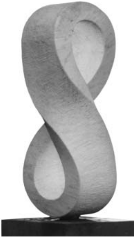
JATAKA'S SPIEGELEN DE ERVARINGEN VAN DE MENS

Vaak beginnen Jataka's met de zin: 'Eens, toen in Benares Brahmadata koning was...' en verwijzen naar een niet precies te lokaliseren, vroeg-mythische tijd. De handelingen en gebeurtenissen geven dan typische levenservaringen van de mens weer; zij bevatten ook vaak herinneringen aan zijn oorsprong. Hij kan zich ermee identificeren, omdat ze appelleren aan oerbeelden, die in elke mens werkzaam zijn.